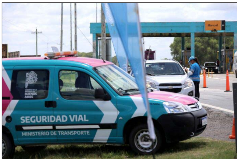
Valor de referencia. Con el ajuste en el precio de las naftas, que se toma de referencia, rigen las nuevas multas para mayo y junio en la provincia

A cuánto pasaron los nuevos valores de las multas de tránsito: