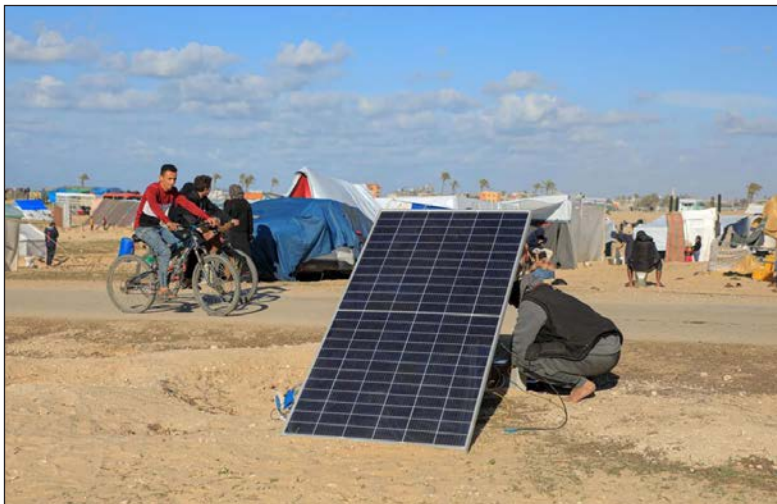
Presión internacional. De Egipto para que exista un cese el fuego en Gaza

En una llamada telefónica con el jefe de los servicios de inteligencia egipcios, Abbas Kamel, el jefe de