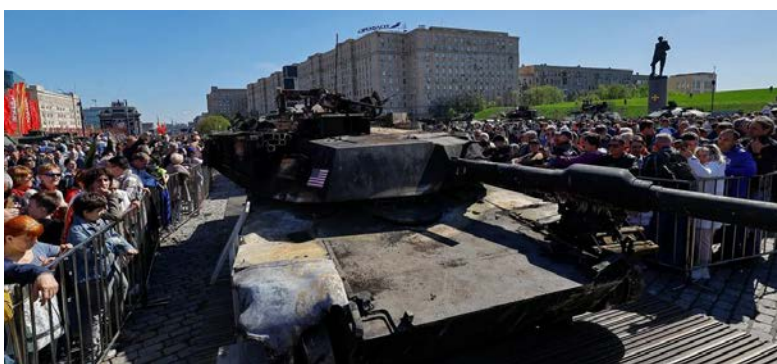
Multitudinaria. Los militares rusos exhibieron en Moscú los tanques capturados en Ucrania

La exhibición de Moscú, que incluye tanques estadounidenses, alemanes y franceses suministrados a Ucrania, se produjo días después de que Estados Unidos aprobó un paquete de ayuda de 61.000 millones de dólares para Kiev y de que Rusia logró algunos avances terri-