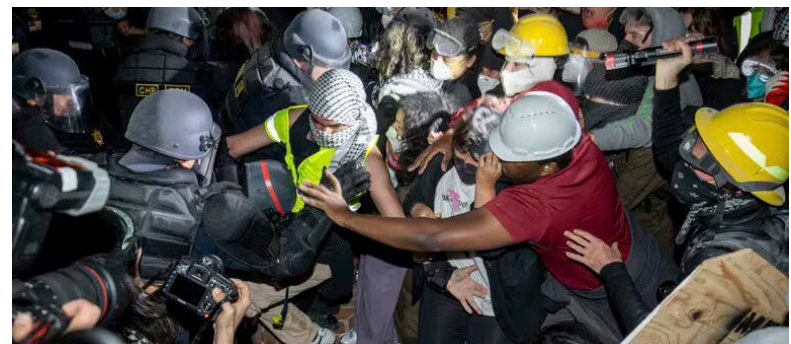
En Los Angeles. Policías avanzan contra manifestantes propalestinos en el campus de la UCLA

Biden enfrentó críticas por su gestión de la situación, presionado por las imágenes televisivas de los disturbios en los campus que recorrieron el país en los últimos días. Hasta ahora había dejado en gran medida en manos de sus portavoces los comentarios al respecto.