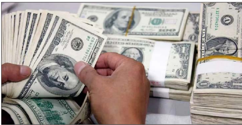
Salir del cepo. Uno de los objetivos que planteó el presidente Javier Milei

De acuerdo con lo que precisaron fuentes del equipo económico de Milei, la idea de esta gestión sigue siendo ir hacia una competencia