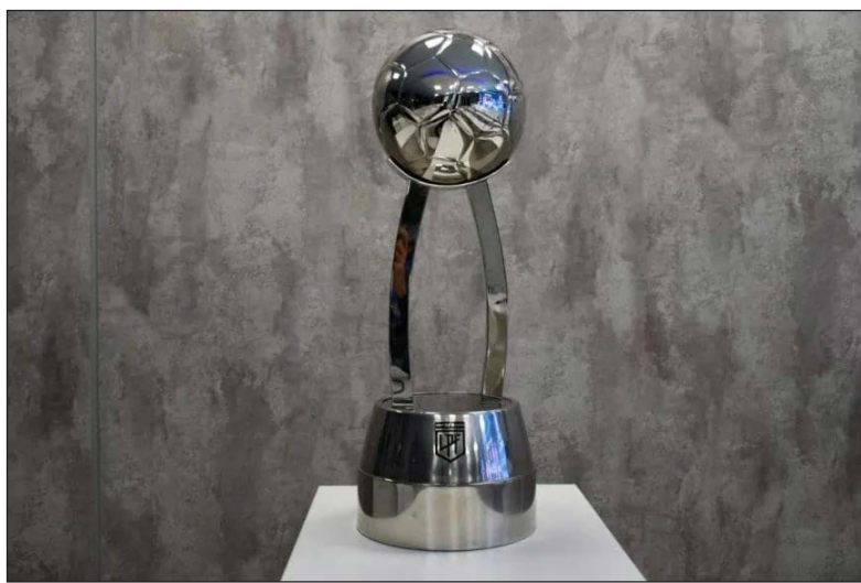
El trofeo. Que se disputan Vélez y Estudiantes, en Santiago del Estero

Aunque en sus vitrinas brillan varios trofeos, todos levantados en el exterior. Si bien todavía no pudo dar la vuelta olímpica en su país, el técnico santafesino sabe lo que es gritar campeón y más de una vez en