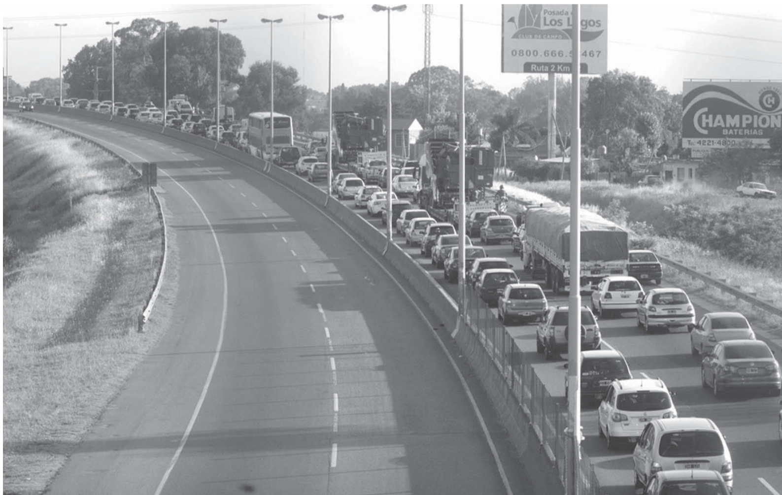
Fines de semana largos. Son 27,5% de los viajes de los argentinos.

El Gobierno difundió los calendarios de 2018 y 2019. Agregó días "no laborables" para recuperar fines de semana largos que tanto repuntan las economías regionales del interior de las provincias. Corresponderán al día previo del 1º de mayo y de las fiestas de Navidad y Año Nuevo. - Pág.5-