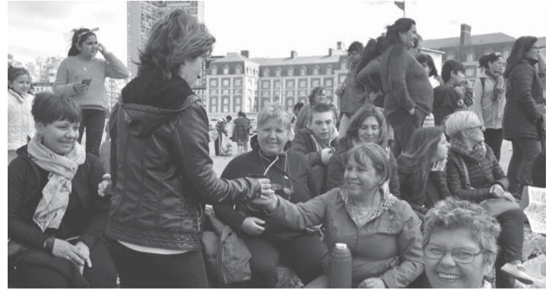
"Para gente común". Bajaron a la playa, en el centro de la ciudad, a pesar del viento.

Turistas y marplatenses se sumaron al repudio contra una vecina de Nordelta que criticó la típica playa local.