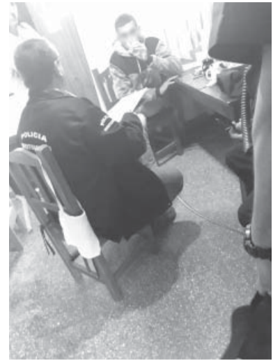
La Plata. La Policía dio con los presuntos delincuentes. - Ministerio de Seguridad BA -