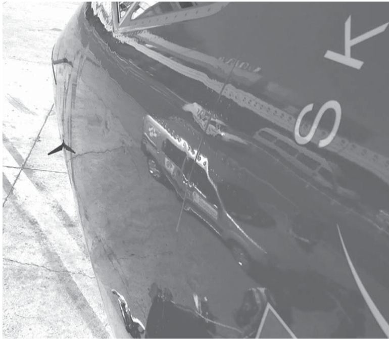
Habló el piloto. "Nos pegó en la nariz, si nos pegaba en un motor lo rompía". - Twitter -

El piloto de la aeronave informó a la Torre de Control lo que estaba ocurriendo mientras dialogaba con el controlador de vuelo en el momento del aterrizaje. No solo relató el momento en que el aparato lo golpeó, sino que además reiteró un informe de dos semanas atrás cuando ocurrió un hecho similar, aunque en ese