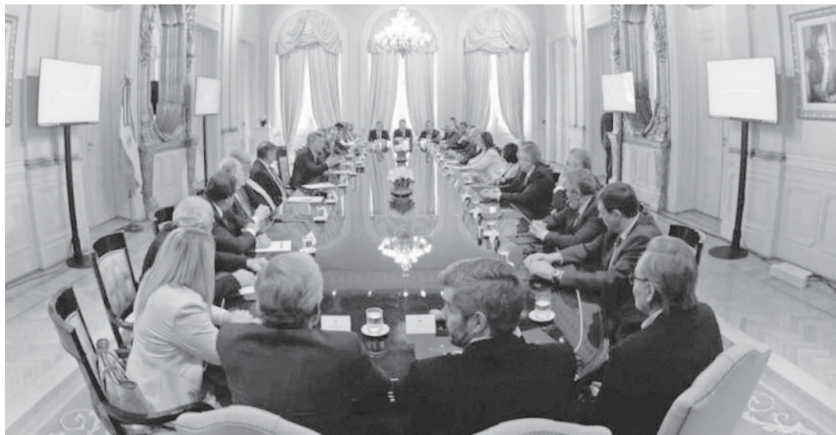
Discusión de fondo. Los gobernadores con el Presidente el jueves pasado en la Casa Rosada.

El año crítico del nuevo esquema es 2019: los fondos que lleguen a través del acuerdo alcanzarán los $65 mil millones, casi la misma cifra que los $62.465 millones previstos para el fondo del Conurbano de este año, de los cuales solo llegan a Buenos Aires 600 millones, debido al tope impuesto en 1996. Pero lo importante es que de ese total, Nación aportará $45 mil millones, $25 mil de los cuales nunca antes habían figurado en el presupuesto.