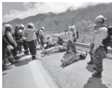
Preventivo. El operativo llevado adelante en la localidad jujeña. - Télam -

"A futuro tenemos un problema no del sistema educativo en sí sino que cambió la manera de que el estudiante tiene de percibir el aprendizaje por lo que el objetivo del docente actual no es estar enseñando todo el tiempo", destacó Zuccoli. - Télam -