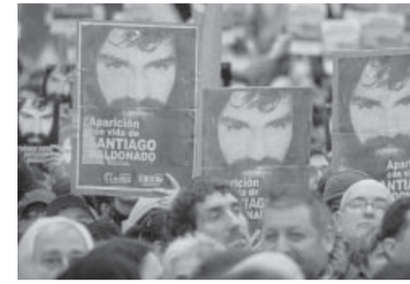
Maldonado fue hallado muerto en octubre.