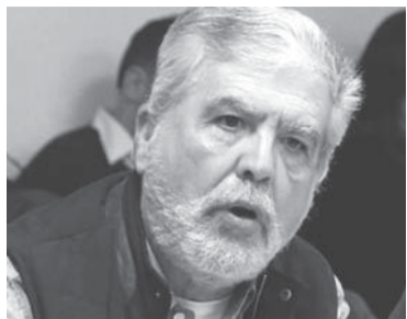
El exministro K.