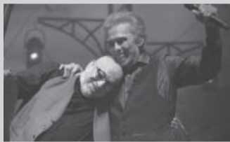
“Nuestras voces suenan muy bien juntas”. - jairo.com.ar -

Jairo se presentó el sábado en el Teatro Coliseo Podestá de La Plata junto a Juan Carlos Baglietto, en el marco del espectáculo “Historias con voz”, un cancionero dedicado a los poetas de habla hispana y a los grandes compositores de la música popular argentina.