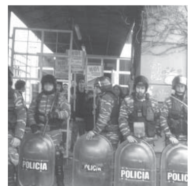
Custodia previa al operativo.

Otros de los cooperativistas que llevaban adelante la protesta contaron al diario La Capital que