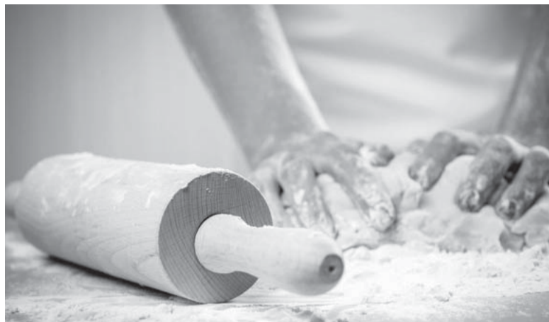
Modelo. El formato es innovador y los alumnos amasan pan.

"La actitud de masar un pan tiene que ver con la conjunción entre el movimiento de las manos y el cerebral al poner todos los ingredientes que lleva la masa. Es una teoría basada en la neuro-