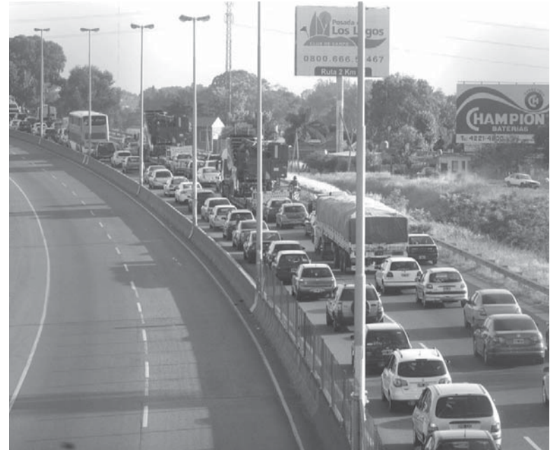
Fines de semana largos. Son 27,5% de los viajes de los argentinos.

El Ministerio del Interior aclaró que los "puentes" no son feriados, si no "días no laborables". La diferencia radica en que en la actividad privada la decisión de trabajar o no quedará en manos del empleador. En los días no laborables no hay actividad en la administración pública ni se dan clases en las escuelas y universidades. Pero en la actividad privada prima la