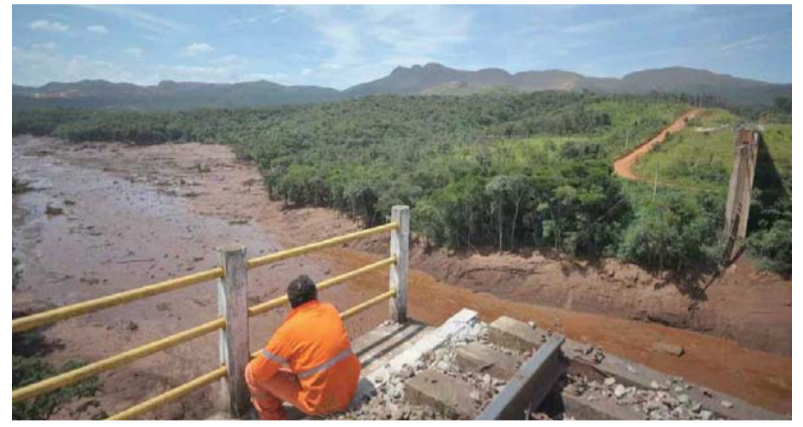
Destrucción. La región se convirtió en un inmenso río de lodo.

En el terreno judicial, la Justicia brasileña ordenó dejar en libertad, de manera cautelar,