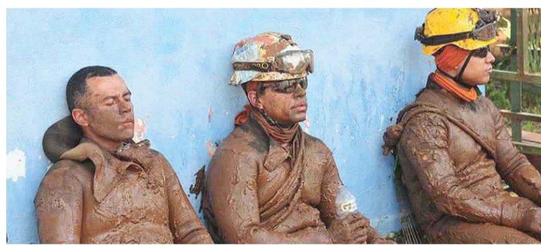
Solo barro. Bomberos descansando después de una operación de rescate.

Mientras tanto, los bomberos de Minas Gerais continuaban con la tarea más ingrata, el rescate de cuerpos, pese a las intensas lluvias que se registran en la zona.