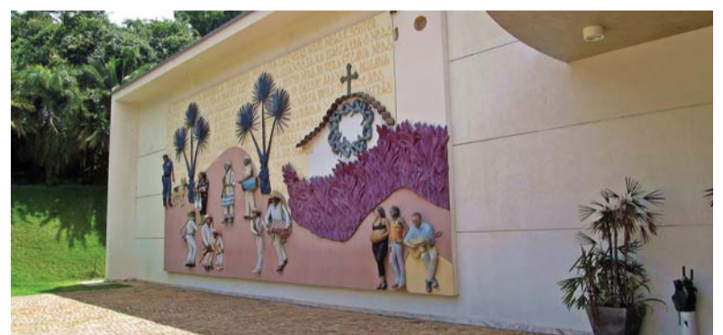
Pérdida. El museo Inhotim.

La actividad turística de Brumadinho, que se caracterizaba por actividades de naturaleza, gastronomía y visitas a su museo Inhotim, fue condenada a desaparecer tras la avalancha causada por la rotura de la represa que arrasó esta localidad del estado brasileño de Minas Gerais.