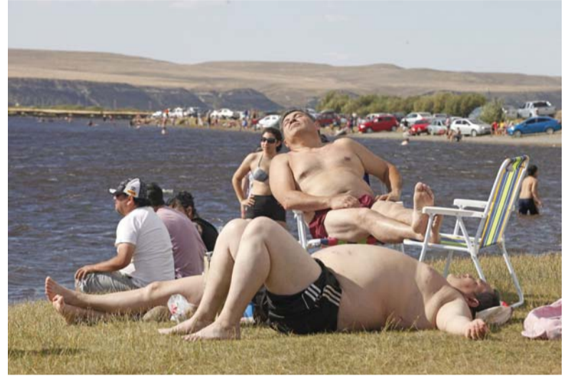
Cuando calienta el sol. Disfrutando el verano en Santa Cruz.

EL SMN explicó además que "del ambiente cálido desde Tierra