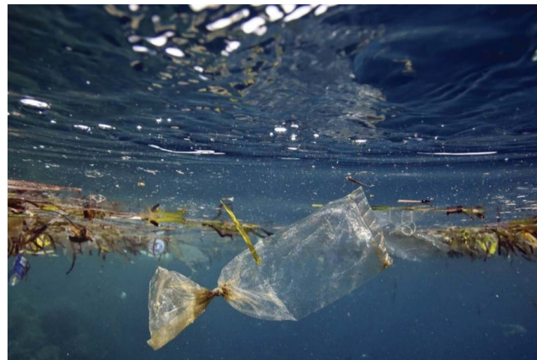
Contaminación. Una de las más graves amenazas de las especies marinas.

Rossi señaló que el “bosque animal marino” es la estructura viva